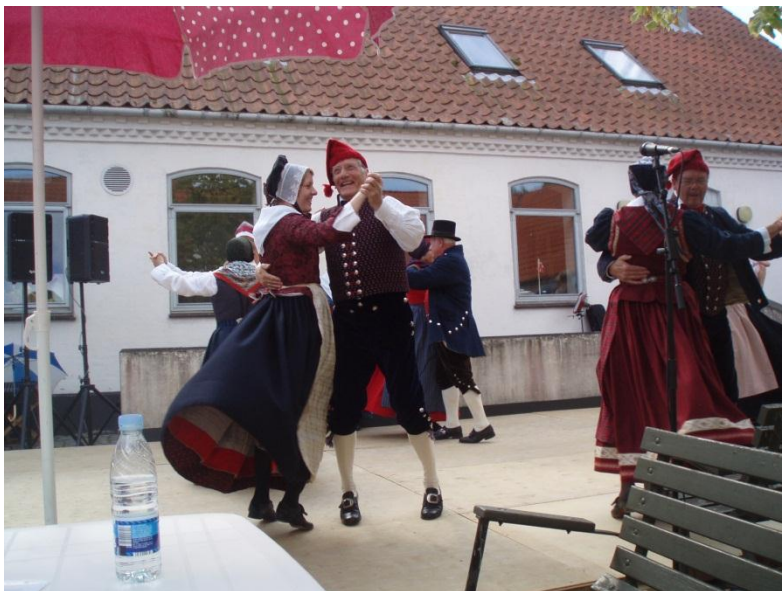
Danseglæde – Høstfesten 2009